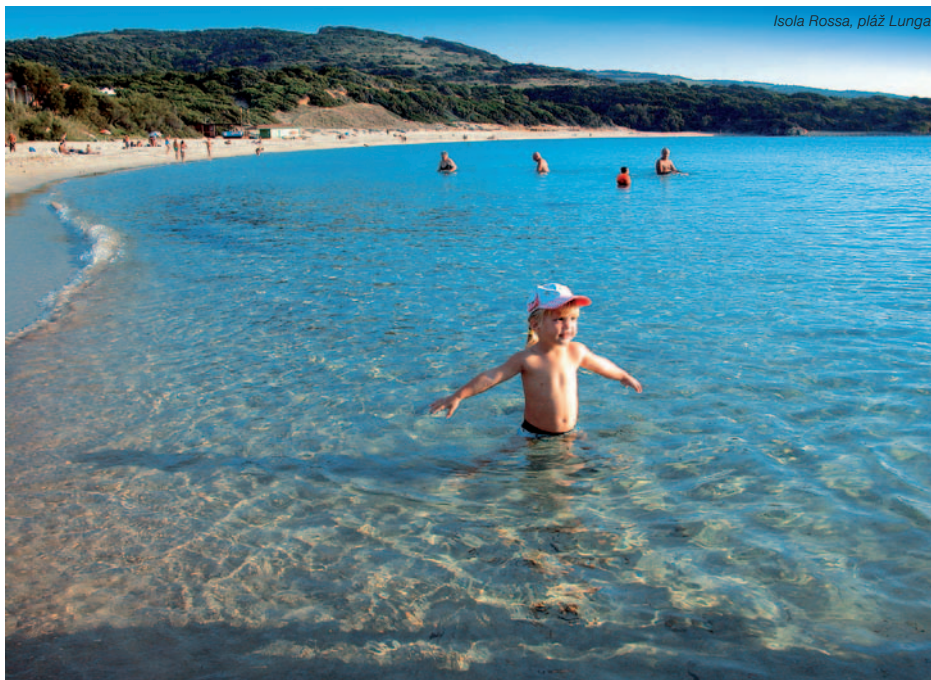
Isola Rossa, pláž Lunga