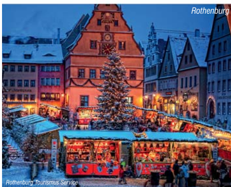
Rothenburg Tourismus Service