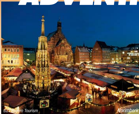
DZI Bayern Tourism