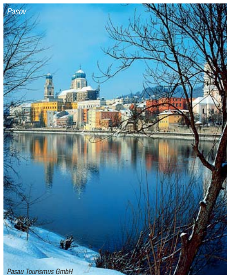
Pasov Tourismus GmbH