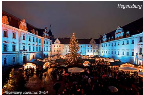
Regensburg Tourismus GmbH