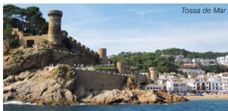
Tossa de Mar