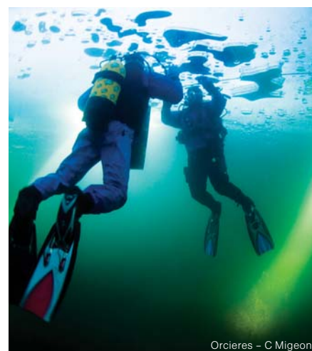
Orcières - C Migeon