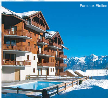
Parc aux Etoiles

Nové rezidence a chalety s venkovním vyhříváním bazénem u sjezdovky