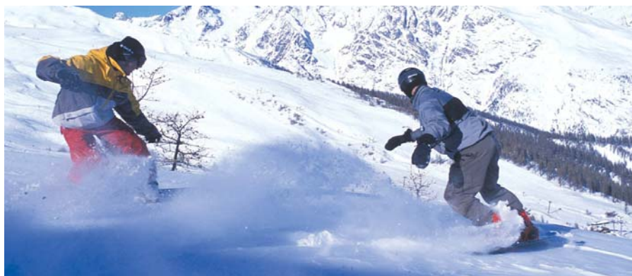
PUY SAINT VINCENT – REZIDENCE HAMEAU DES ECRINS