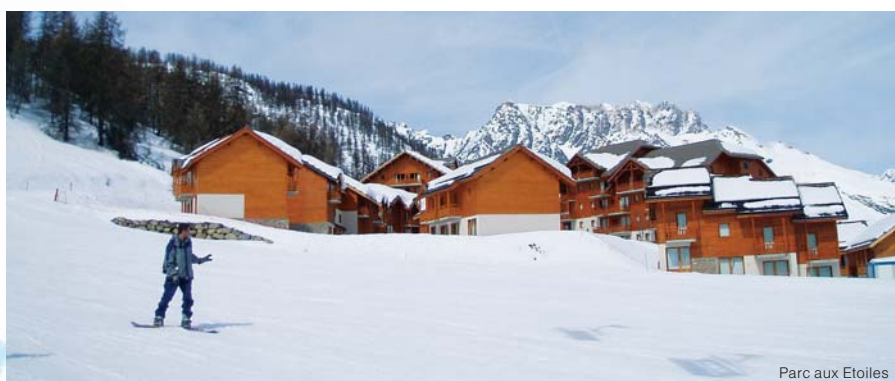
Parc aux Etoiles