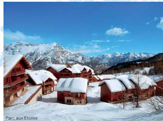
Parc aux Etoiles