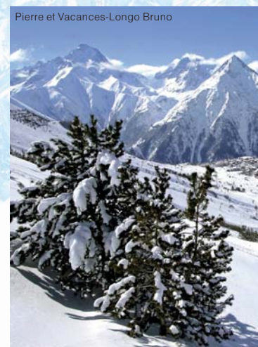
Pierre et Vacances-Longo Bruno

Cena nezahrnuje: závěrečný úklid – vlastní nebo za příplatek 35–40 €/ST, AP, vratnou kauci 1000,- Kč/os. (vlastní dopravou 200 €/ST, AP), dále viz Důležité informace str. 106.