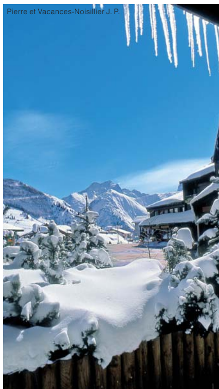
Pierre et Vacances-Noisillier J. P.

Náměstí Vénosc (1650 m), 80 m od nástupu na kabinovou lanovku Diabie. Obchody a restaurace se nacházejí v blízkosti rezidence.