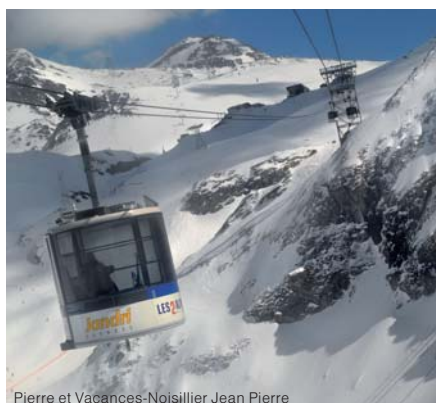
Pierre et Vacances-Noisillier Jean Pierre