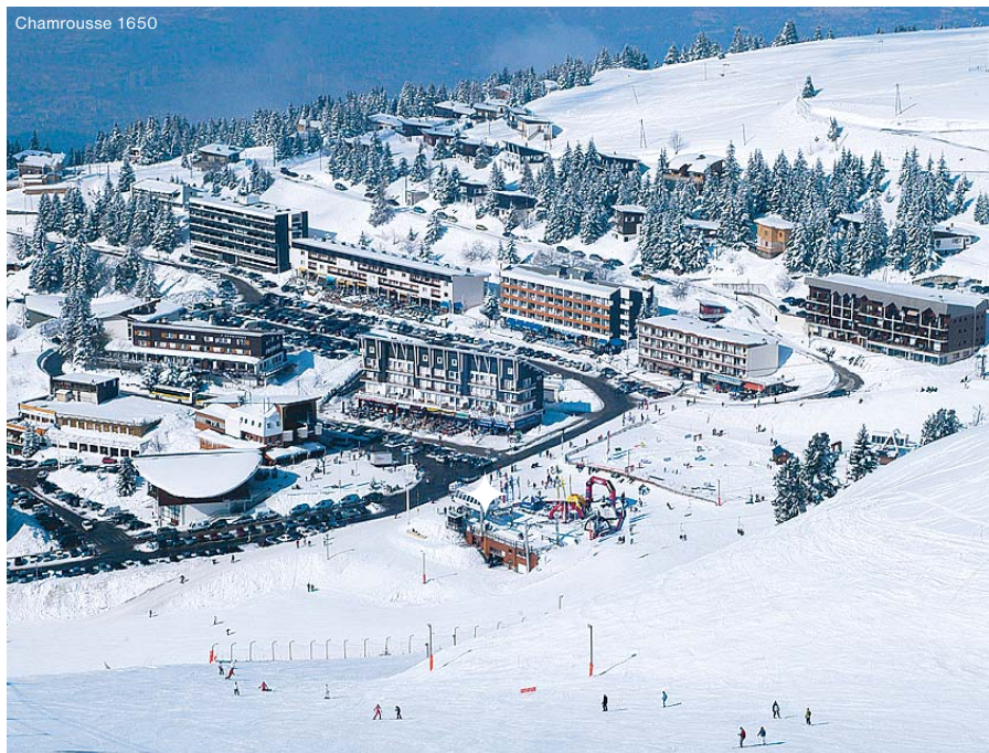
CHAMROUSSE – REZIDENCE DOMAINE DE L'ARSELLE