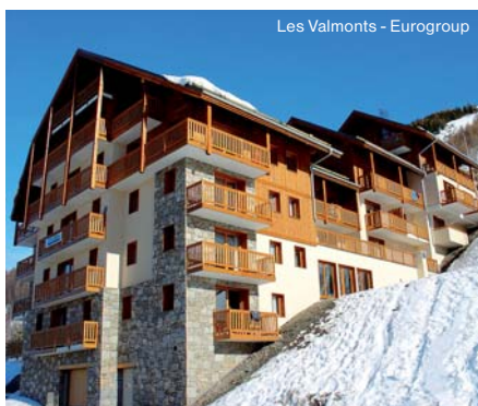
Les Valmonts - Eurogroup

Nová rezidence s krytým bazénem, vířivkou a saunou