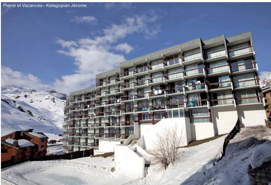
Pierre et Vacances - Kelagopian Jérôme

Rezidence: recepce, výtahy, lyžárna, úschovna zavazadel, stolní tenis (pálky na vratnou kauci); zdarma k zapůjčení na recepci: fén, žehlička, společenské hry; za příplatek: kulečnick, WiFi, kryté nebo venkovní parkoviště 75 €/týden (rezervace předem).