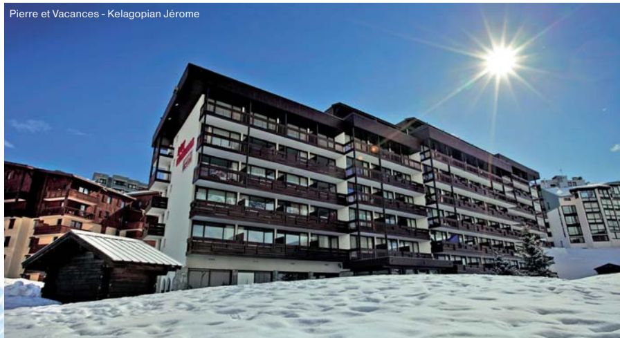
Pierre et Vacances - Kelagopian Jérôme

Nedávno zrenovovaná rezidence s bazénem a saunou v Tignes Val Claret