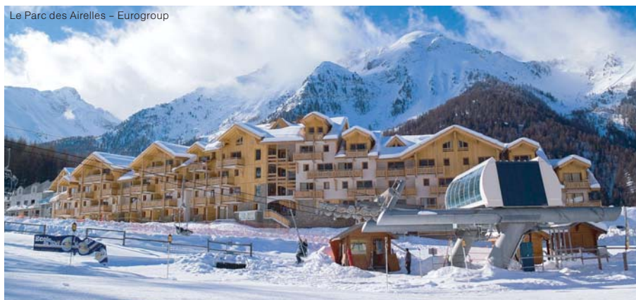
Le Parc des Airelles – Eurogroup

Nedávno postavené rezidence nabízející pěkné ubytování u sjezdovky s bazénem